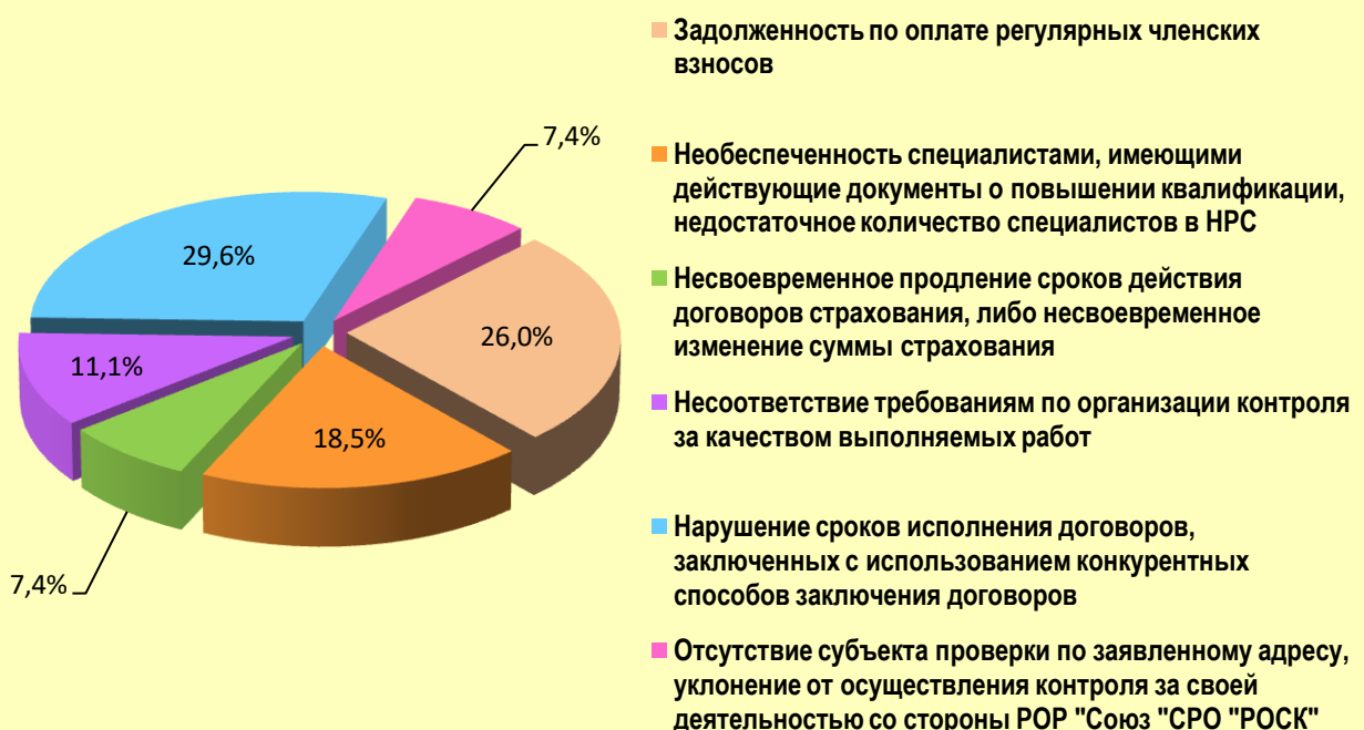
Основные виды несоответствий требованиям законодательства и внутренних документов РОР "Союз "СРО "РОСК" в 2019г.