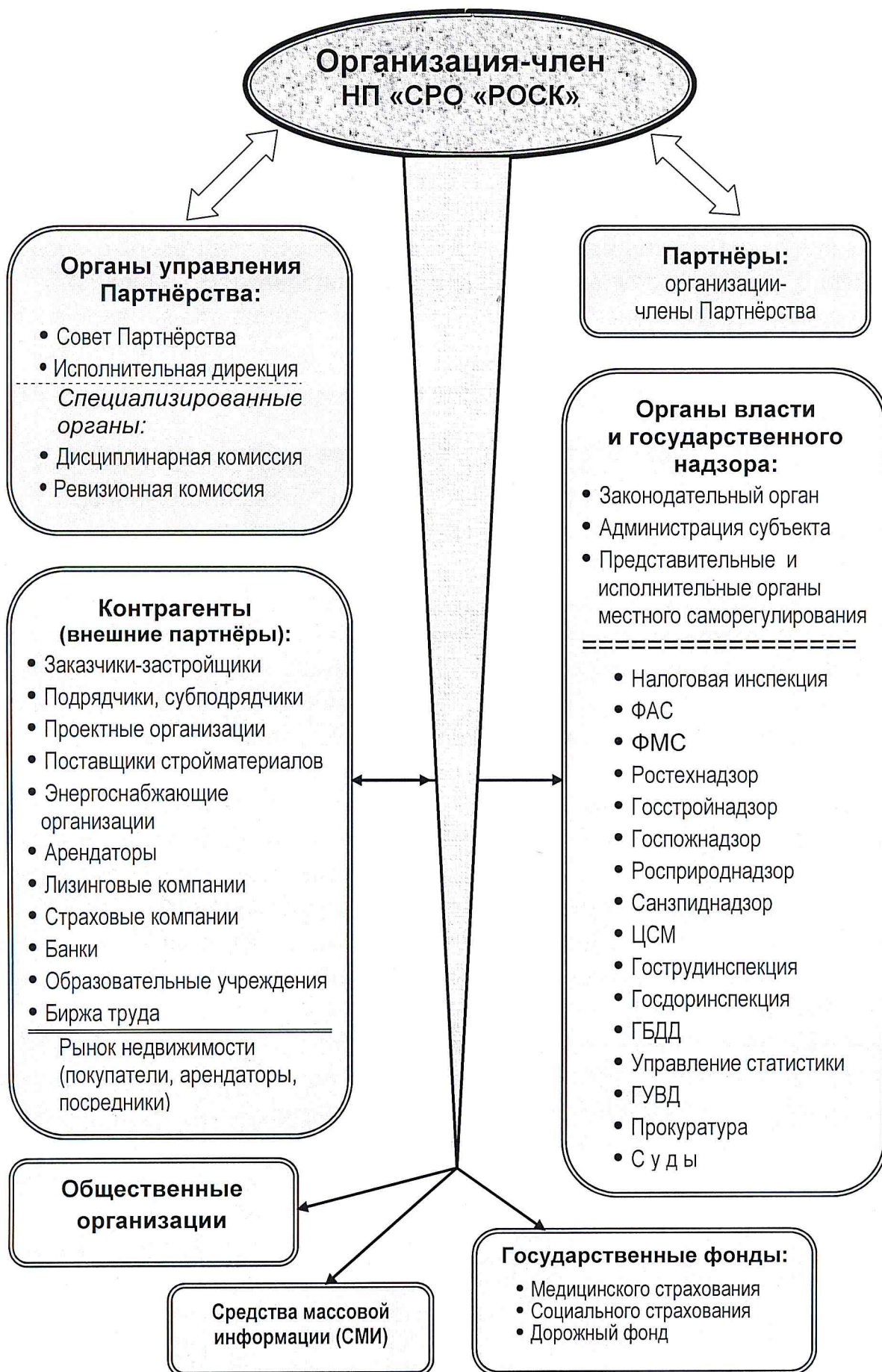
Схема взаимодействия и деловых связей членов НП «СРО «РОСК»